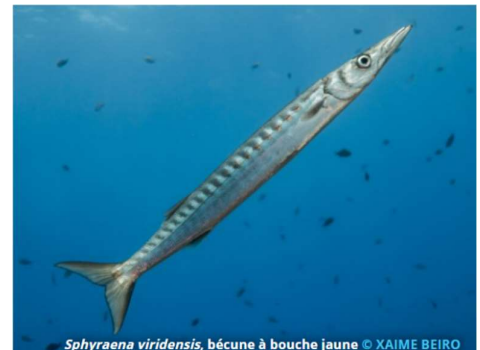
Sphyræna viridensis , bécune à bouche jaune

Sans utiliser le Z on peut marquer 40 points en jouant MANDALE (gifle). Pour cela il fallait avoir anticipé AFAT