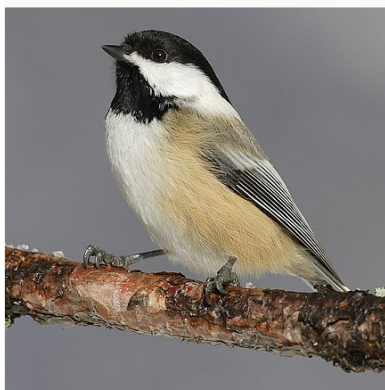
Mésange à tête noire

SWIN, GIGOTEZ et KIEFS prenaient quelques points.